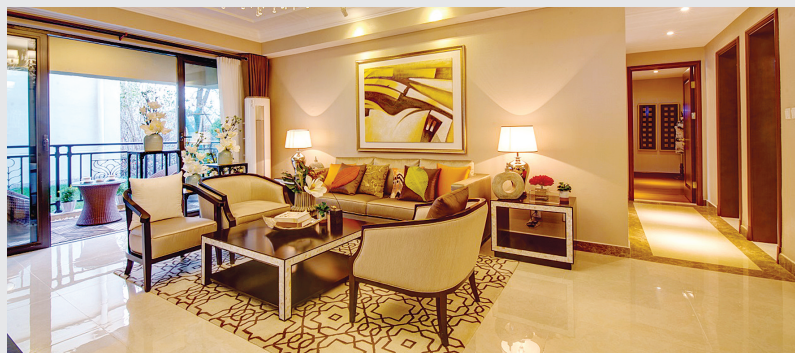
郑开恒大未来城样板间