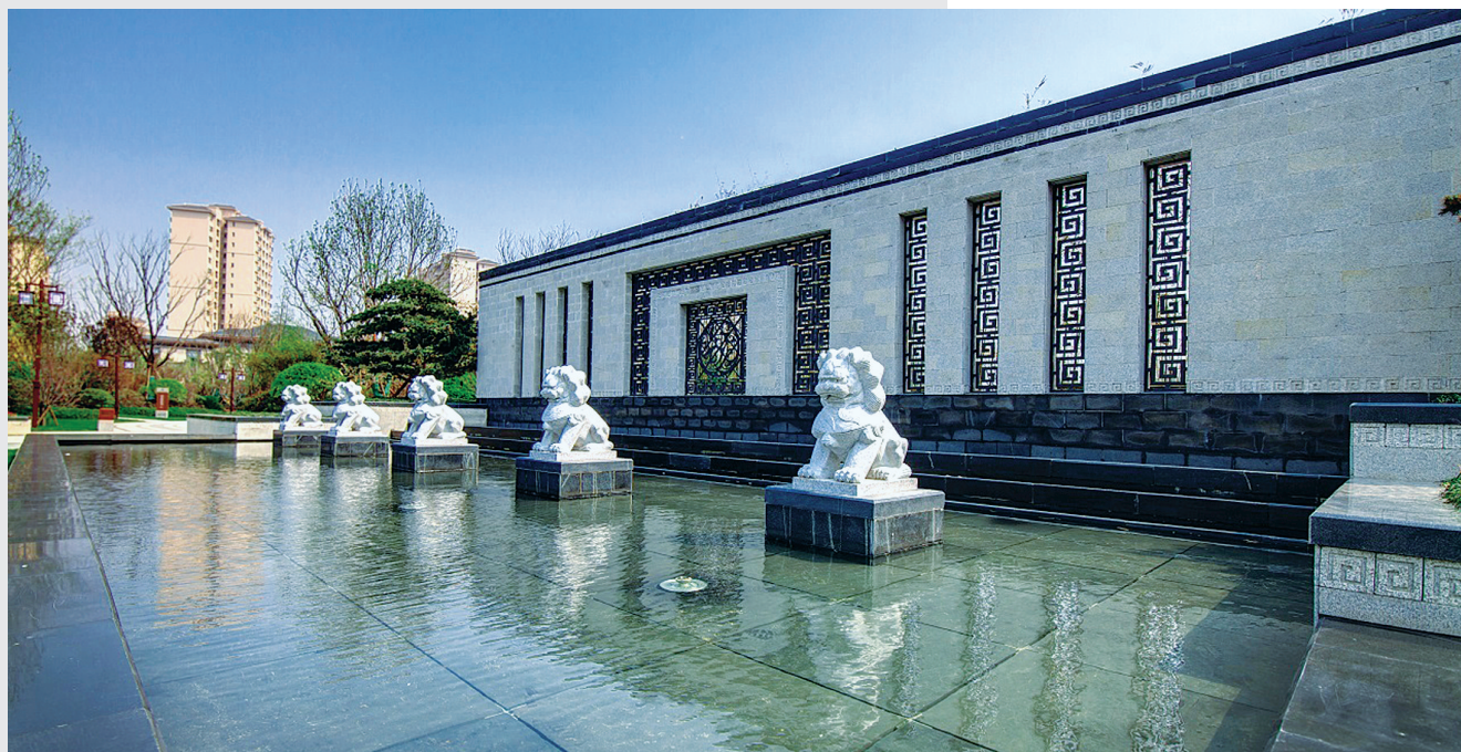
郑开恒大未来城新中式景观