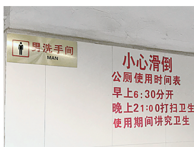
淮河路和嵩山路口公厕的开放时间