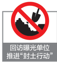
回访曝光单位 推进“封土行动”