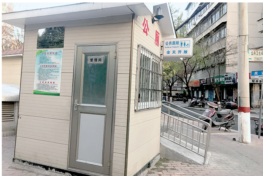
淮河路兴华街路口一24小时公厕