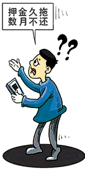
据新华社漫画制作