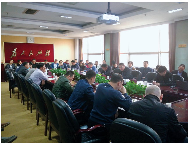
惠济区每周召开大气污染防治分析研判会