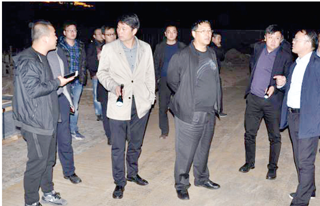
惠济区区委副书记、区长马军(右三)带队开展联合夜查,督导辖区工地封土期间管控措施落实情况