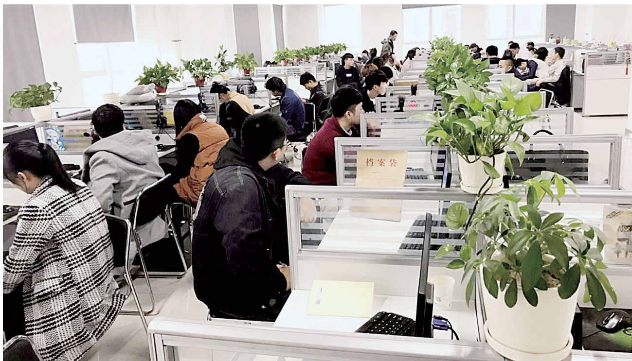
抓捕现场涉案人员被控制

本报讯 近日,丰产路公安分局案件侦办大队紧盯近一阶段打掉的“淘宝客”网络诈骗团伙案件,一举逮捕犯罪嫌疑人15人,涉案金额600万余元。