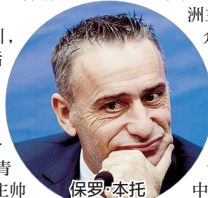
保罗·本托 事实上,不单是中超,在欧洲和亚洲足球舞台,葡萄牙主帅也已经取得了巨大成功。尽管未来中超培养本土教练会是一个方向,不过对于能力出众,在欧洲主流舞台得到验证的葡萄牙主帅来说,中超并没有太多理由拒绝。这些正在欧洲闯荡的葡萄牙名帅,谁会来到中超?阿帅