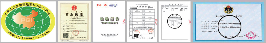
在探访期间笔者查看了优品羊绒裤检验报告、营业执照和出口备案证明等相关手续,真实正规。

董总特别强调:“这次虽然价格低,但是质量不低,售后服务不低,在国家服装包换政策之外,若有任何问题,3天内包退!”