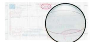
图为笔者在呼和浩特某商场购买的发票,全国统一价确实为1158元。

低很多。董总抱歉地说,毕竟羊绒裤的销售旺季只有当前短短两个月,迫不得已采取超低价策略,当然这样的价格仅限于各读者朋友,在此希望同行们的谅解!