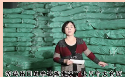
等待出口的羊绒裤堆满了七八个大仓库

近日,一条重磅消息震惊羊绒纺织行业,来自鄂尔多斯的羊绒裤以198元的超低价位,在各大媒体推广,吸引了无数消费者的热烈抢购。消息如下:由于全球经济下滑,内蒙古鄂尔多斯市优品羊绒生物科技有限公司、出口俄罗斯的羊绒裤被迫“出口转内销”。为打开中国市场,8万条优品羊绒裤,国内全面发售,限时秒杀!专柜价1158元的优品羊绒裤,减掉省级代理费479元,减掉商场扣点费337元,减掉出口关税33.6元,减掉所有中间环节,减掉所有一切杂费,现在只需成本价198元,即可拥有。每天前50名打进电话,买3条送1条。而且厂家保证每一条羊绒裤的质量,并在严格执行国家服装包换政策之外,还有更好的承诺:如发现裤子质量不好,3天内无条件退货退款!