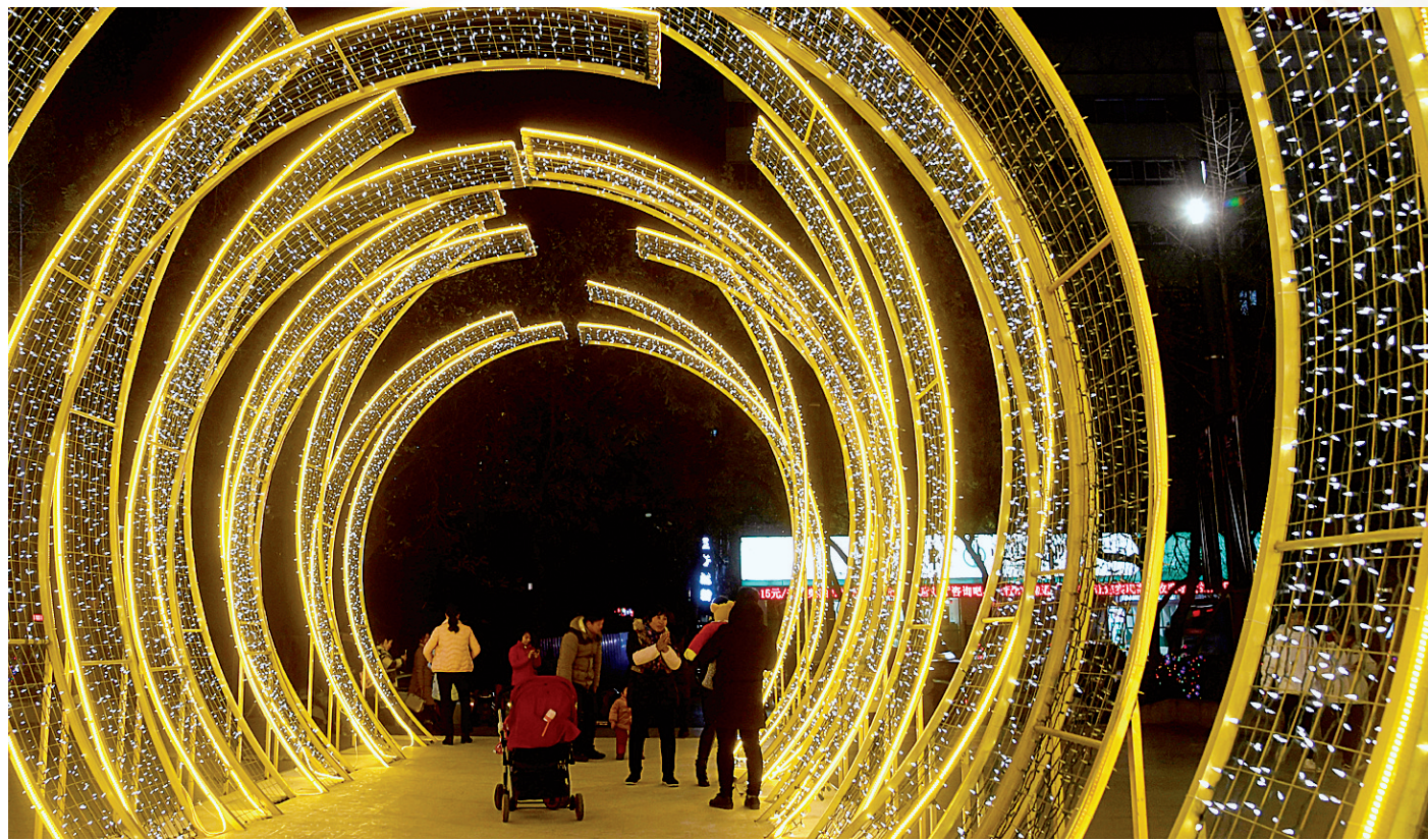
新年临近,市区各商场和广场彩灯闪烁,点靓了夜郑州。郑报融媒记者 周甬 图

本报讯 年前还会不会下雪?最新权威消息已经来了。省气象台消息称,本周有两次冷空气影响我省,大部分地区有一次雨夹雪或小到中雨天气过程。从年底前的天气预报看,郑州市区降雪的可能性不大。