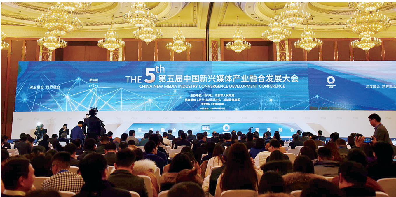
12月26日,第五届中国新兴媒体产业融合发展大会在成都举行。