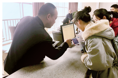
工作人员为群众答疑解惑

咨询台前摆放的宣传材料不到一个上午便所剩无几。除了在服务中心宣传,在地铁一号线省体育中心站出站口附近,博学路办事处专门设置了宣传点,向过往的群众发放“智汇郑州”人才工程政策宣传材料。“智汇郑州”人才计划开始申请补贴了,刚毕业的大学生前来看一看……”尽管天气寒冷,工作人员的热情却丝毫不减,也吸引了众多过往行人前来询问。