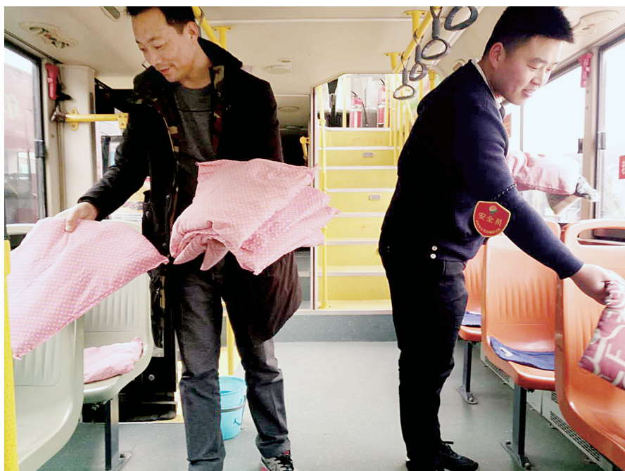
公交车座上放上棉垫子