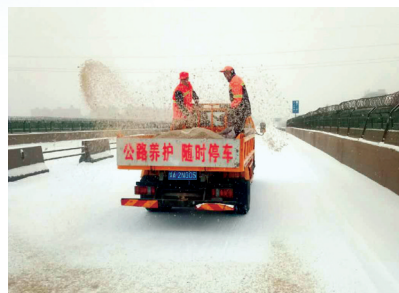
雪防滑作业,针对辖区干线道路上的陡坡、弯道、桥梁等重点布控路段抛撒融雪剂约7吨,防滑料约20立方米。 新郑时报 邓春丽 通讯员 黄晓梅 文/图

详细划分9个道班各自分管的路段,确保辖区国省干线公路全覆盖,无缝隙,安排专人定时巡查,从全局各个部门抽调应急人员100名,成立冬季除雪应急分队,充分筹备物资,调配融雪剂撒布车、铲雪车、轮式装载机、平地机、轻载货车等机械清雪设备。1月3日22点开始,该局对所辖国省干线公路进行不定时巡查和融