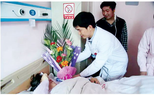
每逢节日,医护人员为患者送上祝福,使医患关系更加和谐