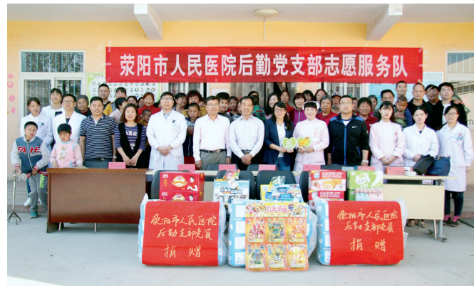
医护人员到郑州市儿童福利院王村康教中心捐赠物资