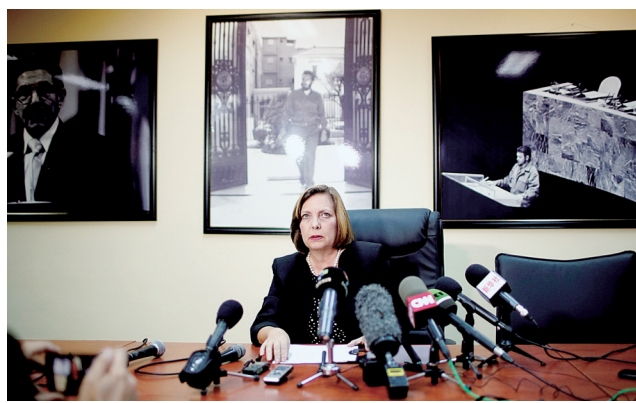
古巴外交部高官何塞菲娜·比达尔在新闻发布会上发言

美国国务院多名高级官员9日出席国会参议院外交委员会听证会,就驻古巴外交人员身体出现异常一事作出解释。继“声波攻击”后,他们搬出另外一种说法,即某种恶意传播的“病毒”可能是致使24名美国人“生病”的原因。