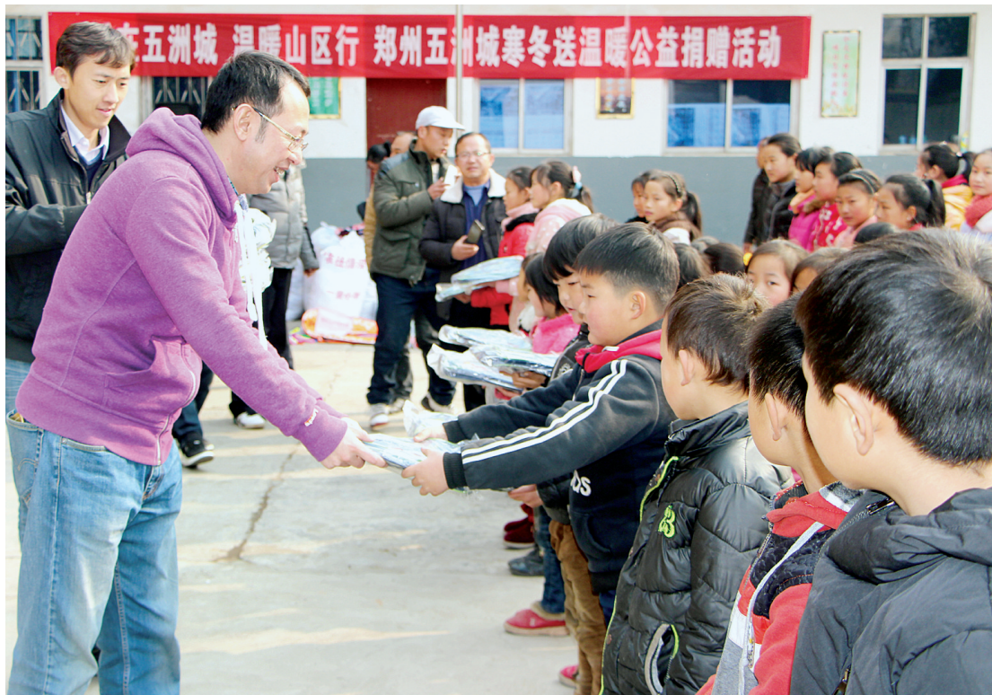
郑州五洲城向山区小学献爱心

2016年12月29日, 郑州五洲城举行盛典, 对十大杰出商户和两家特殊贡献奖颁奖, 营造了脚踏实地、争先创优的浓厚经营氛围。