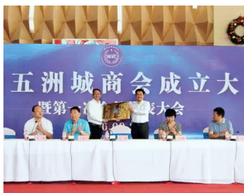
郑州五洲城商会成立