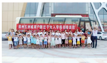
郑州五洲城商户随迁子女入学问题得到妥善解决