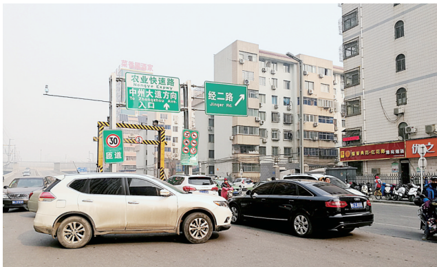
农业路经三路立交南侧, 调头的和逆行的车辆混作一团

他呼吁在路口区域的地面道路没有完全修好之前, 设置经三路(丰产路到农业路段)南向北、政七街(农业路到丰产路)北向南机动车道单行, 最大限度地提高此处的通行效率。