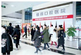
植得口腔医院候诊大厅