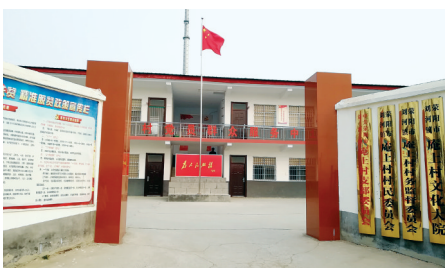
改造后的庵上村村级阵地