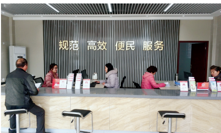
新的便民服务中心启用