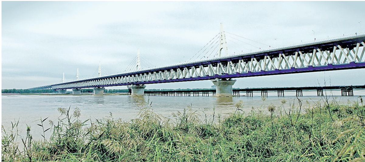
省人大代表建议由省级层面改变目前郑新黄河大桥的管理收费机制,推动郑新融合发展。 资料图片

推进文化高地建设,让百姓有更为丰富的精神生活;建好城市交通,让城里人出行方便;关注农村交通,让村民进城方便。连日来,省人大代表们针对各项事业发展进程中出现的热点问题,畅谈建议,好声音不断,好主意频出。