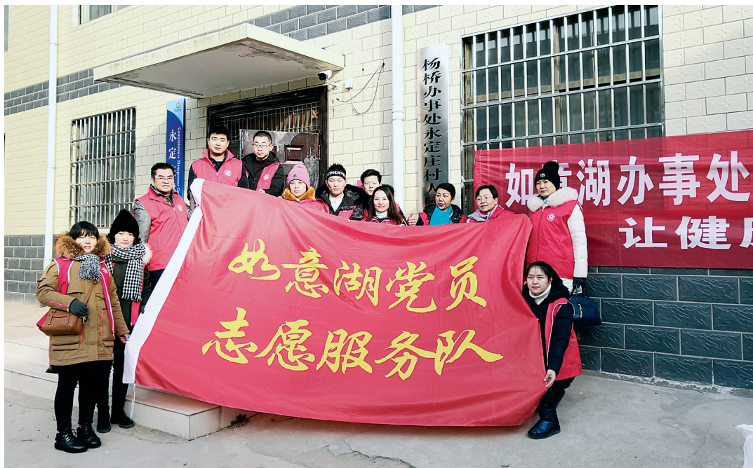
如意湖党员志愿服务队慰问永定庄村