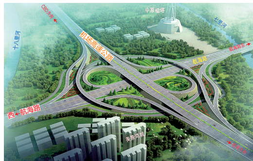
机场高速航海路立交效果图

本报讯 昨日,全市交通运输工作会议召开,对2017年交通运输工作进行回顾,对2018年的重点工作进行部署。巡游车的服务及运价提升、网约车的规范与发展等问题也在会中提出,市民关心的机场高速航海路互通式立交今年将建成通车。 郑报融媒记者 刘凌智 黄永东