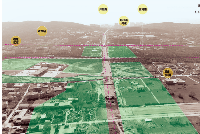
道路的建设,带动着城市的发展