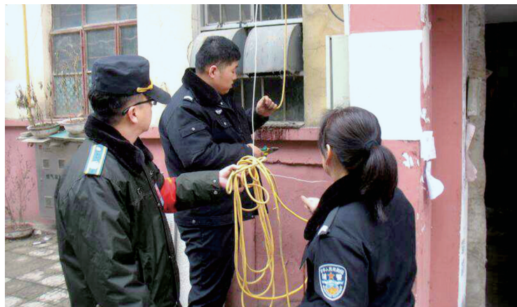
剪除电动车违规充电电线

本报讯 昨日下午,二七区建中街办事处安监办积极配合我市电动车消防安全隐患整治行动,对辖区内存在的电动车飞线充电等违规行为进行排查整治,在短短两个小时内剪除电线200多米、清理插座100多个。