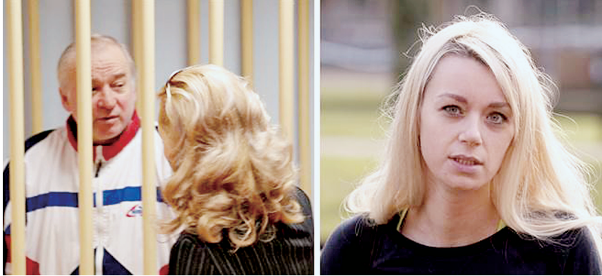
66岁的斯科里帕尔和33岁女儿尤利娅

新华社电 受英国庇护的前俄罗斯“双面间谍”谢尔盖·斯科里帕尔疑似中毒后陷入昏迷,使英俄外交关系再生风波。英方调查尚无定论,但英国外交大臣警告,一旦查出斯科里帕尔受害为俄方幕后操纵,英方将给予“强有力”反应,为惩罚俄方采取“必要措施”。俄罗斯方面否认与斯科里帕尔受害案有涉,指责英方未经调查就发表指向俄方的推断,是一种反俄宣传。