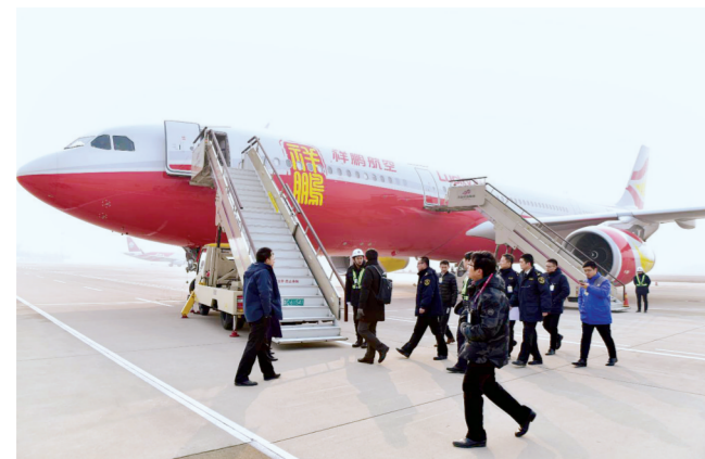
河南首单飞机租赁业务落户航空港实验区