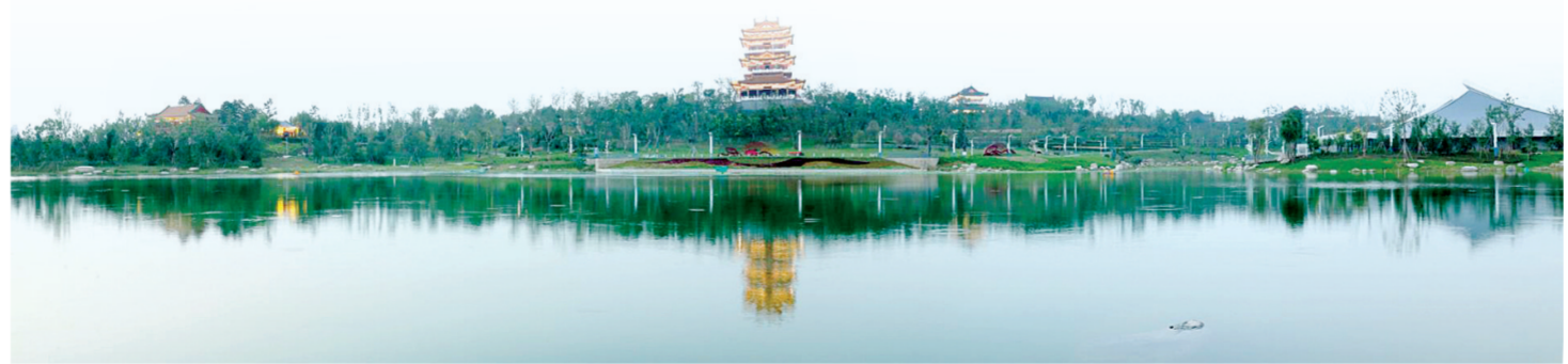
郑州园博园景色

万平方米合村并城工程已开工84.2%,南水北调渠以西区域基本完成建设,5万多村民回迁城市居民社区。省立医院开诊,三甲医院实现零的突破。郑州第一人民医院港区医院正在建设,社区卫生服务中心建设逐步完善,已形成15分钟就医服务圈。教育水平快速提升。全市唯一小学入学年龄提前到6岁。医疗保险、养老保险实现全覆盖。脱贫攻坚取得阶段性成果。