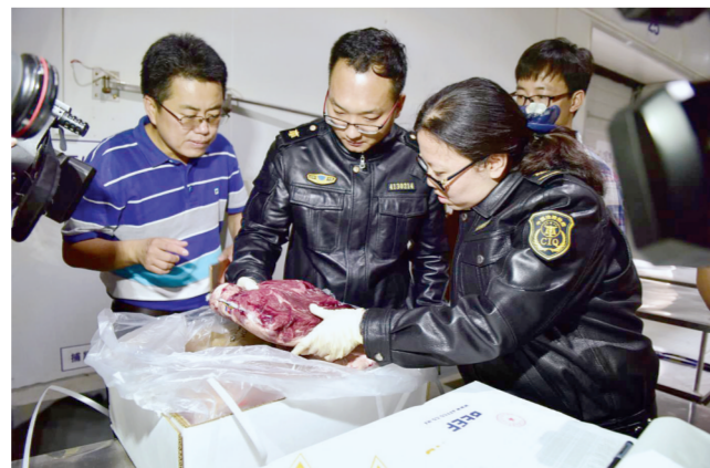
河南进口肉类指定口岸内,检验检疫人员对产品进行检查