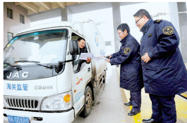
严寒下,郑州新郑综合保税区卡口值守的工作人员