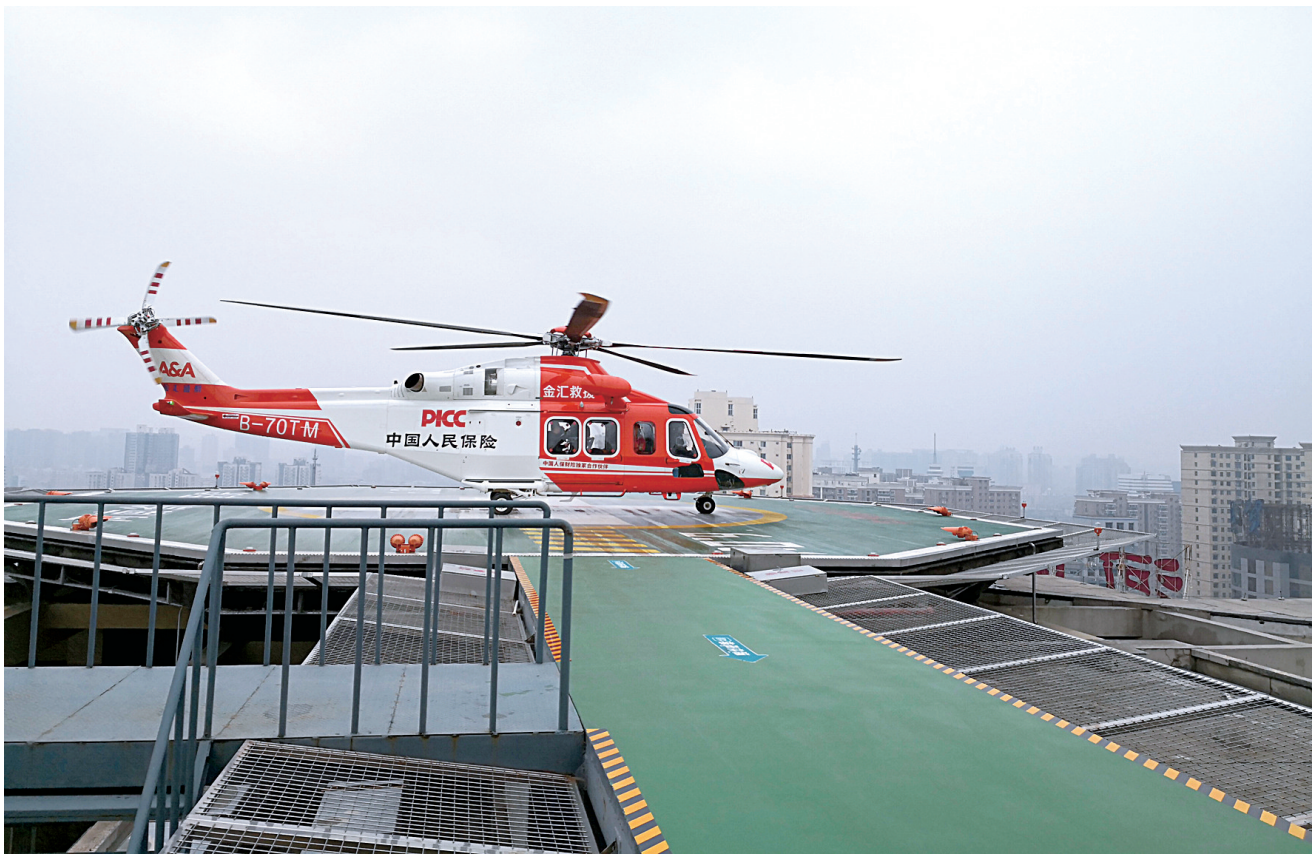
河南省人民医院楼顶停机坪停落的急救直升机