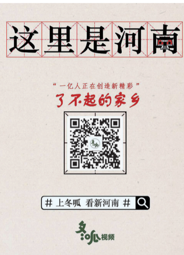
冬瓜视频推出的《这里是河南》系列短视频