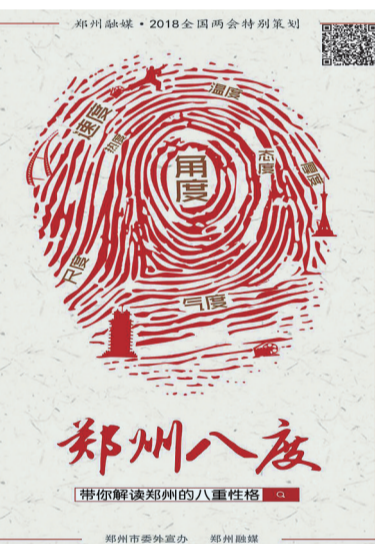
重磅策划《郑州八度》系列城市微视频