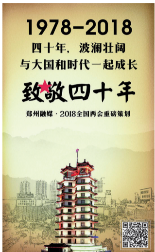
郑州五大媒体联合推出大型专栏「回首40年」