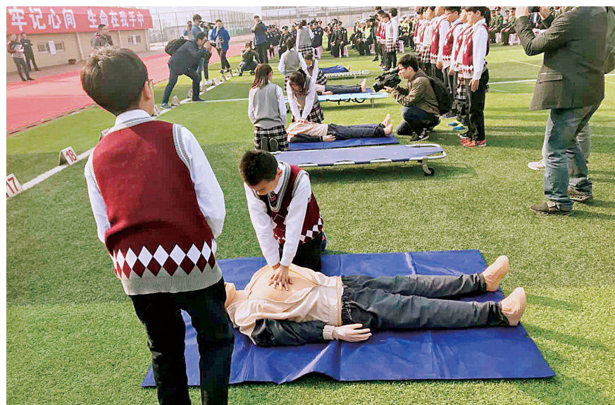
启动现场,学生学习急救技能