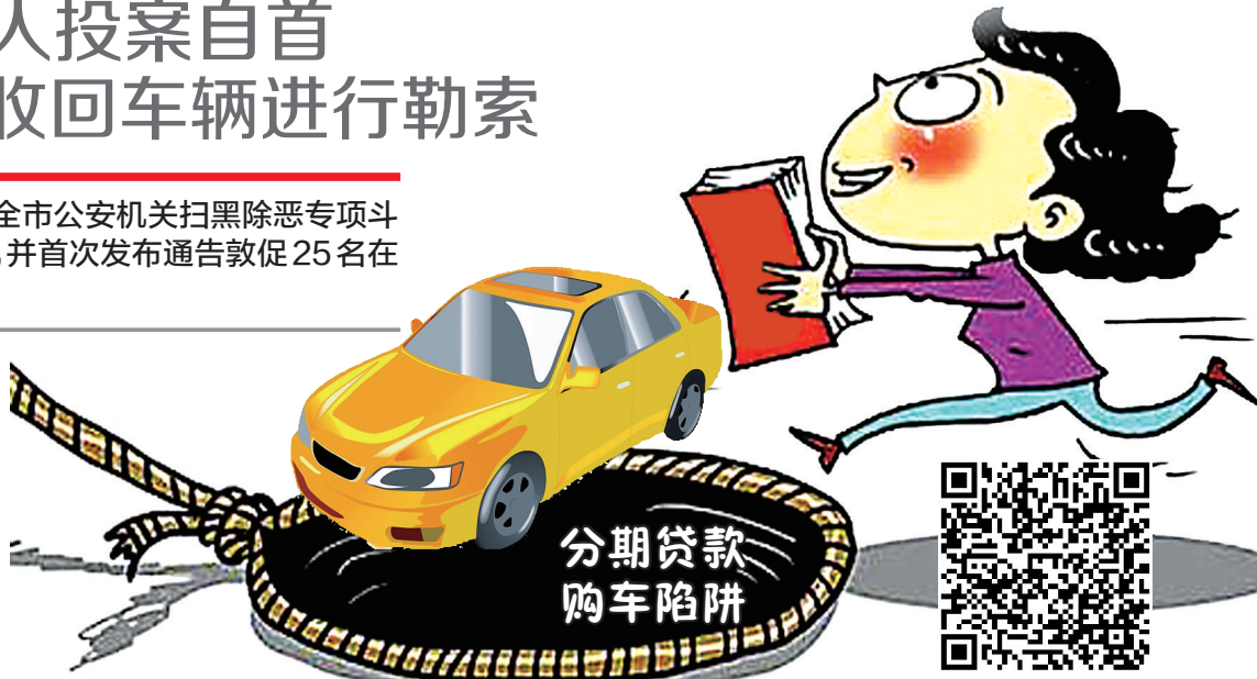
扫码看看25名嫌疑人是谁 有非法收车线索及时报警

嫌参与非法收车违法犯罪，公安机关已掌握确凿证据，应立即到公安机关投案自首！”在新闻通气会上，郑州警方发布通告敦促25名在逃涉黑涉恶犯罪嫌疑人自首。据介绍，下一步，郑州警方将根据扫黑除恶专项斗争开展情况，不定期地发布通告，对黑恶犯罪在逃人员敦促投案或公开缉捕。同时，警方希望广大群众积极检举揭发非法收车违法犯罪线索，特别是曾被非法拖车的车主，要尽快到公安机关报案。