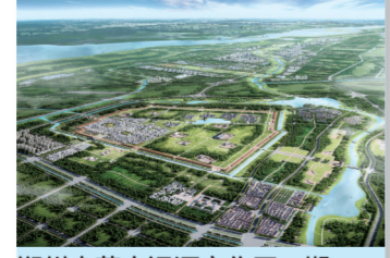
郑州古荥大运河文化区一期