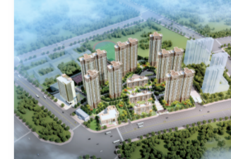
裕华惠江城市广场