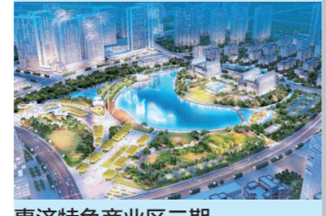
惠济特色商业区二期