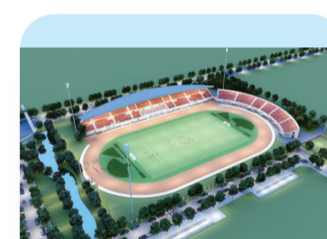
郑州师范学院体育场项目

参与此次集中开工活动的共有惠济区道路基础设施建设PPP项目、惠济特色商业区二期、郑州古荥大运河文化区一期建设项目、郑州四中新建项目、郑州师范学院体育场看台、郑州市老年公寓、和昌珑悦商业中心、裕华惠江城市广场、张砦村城中村改造安置区、惠济区公园游园建设等10项(批)重点项目,总投资达到226.2亿元,年度计划投资84.2亿元,涵盖了基础设施、民生工程、新型城镇化、生态建设等多个领域。