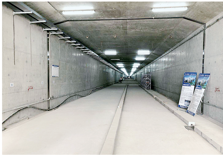
白沙园区综合管廊一期工程通过验收

本报讯 昨日,记者从郑东新区管委会获悉,作为郑州市入选国家地下综合管廊试点城市后的首个落地项目,郑东新区白沙园区综合管廊一期工程顺利通过首段主体结构验收,标志着白沙管廊项目建设迈出实质性的一步。