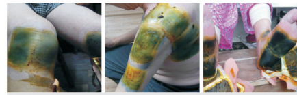
祛除湿寒、拔出青紫、眼见为实!

请您拿起电话马上预约。试一试也许就能圆您过正常生活的心愿,名额有限赶紧拿起电话报名吧!