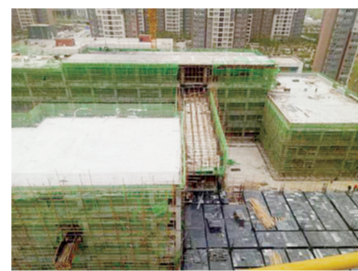
顺利完成工程封顶。

经开六中自2017年7月开工以来，历经260多个日夜，精心组织、安全文明施工，现场严格按照“8个100%”和“两个禁止”落实，成立“进度督导组”，倒排工期，最终