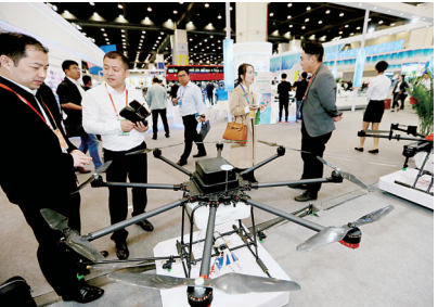
展览的无人机吸人眼球