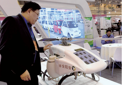
洽谈会展览区的无人机

论坛现场,有5个合作项目举行了签约仪式。5个项目分别为欧洲(许昌)公共海外仓项目、中德中小企业合作区项目、史太白国际技术转移(许昌)中心项目、中德企业合作健康养老项目、帕希姆机场跨境电商许昌中心体验店项目。 记者 黄永东