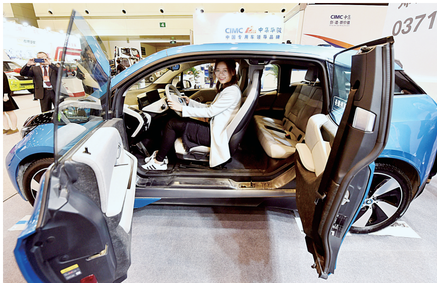
客商在投资贸易展览展示区体验新能源汽车

省长陈润儿、中国银行董事长陈四清分别致辞,中国银行副行长张青松主持会议,并共同见证现场签约。 河南日报记者 屈芳 本报记者 徐刚领 赵柳影