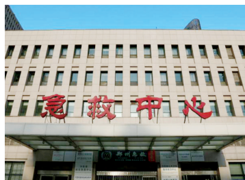
急救中心楼顶标识招牌已拆除