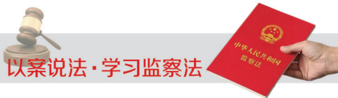
以案说法·学习监察法