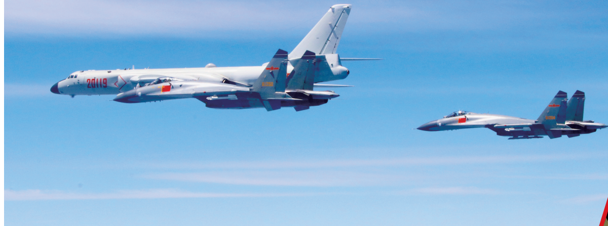
4月26日,人民空军轰-6K等多型战机实施“绕岛巡航”训练课题

针对此次远海训练中多风险叠加、对抗课目实施难度大等特点,编队指挥所强化风险预测,开展专题研究,通过准确研判水文气象情况、精准研判海空情况、灵活运用多种战术手段、科学配置编队兵力,达到了预期训练目的。