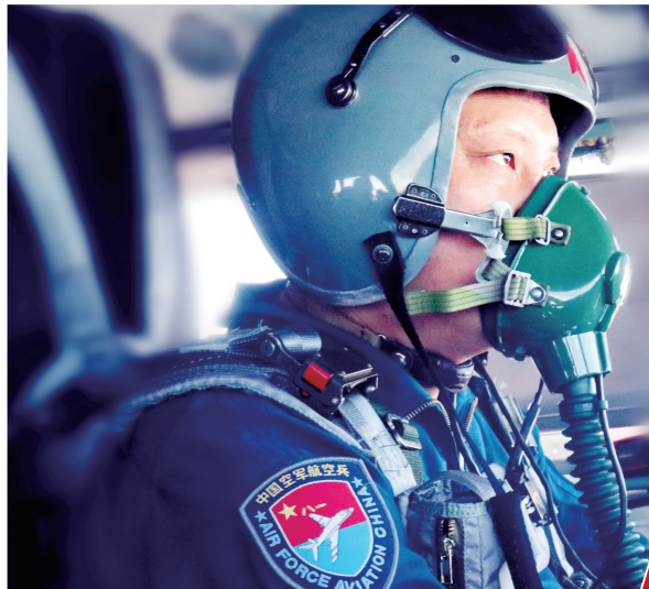
中国空军轰-6K飞行员执行“绕岛巡航”任务