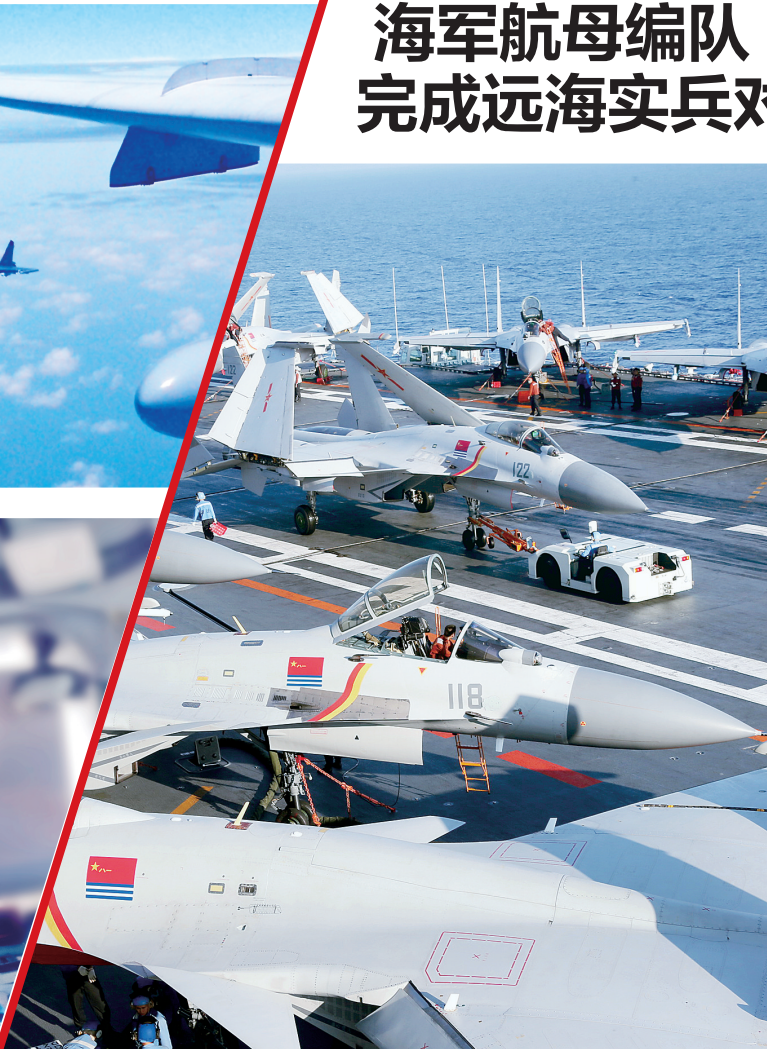
4月17日,海军航母编队持续实兵对抗提升体系作战能力