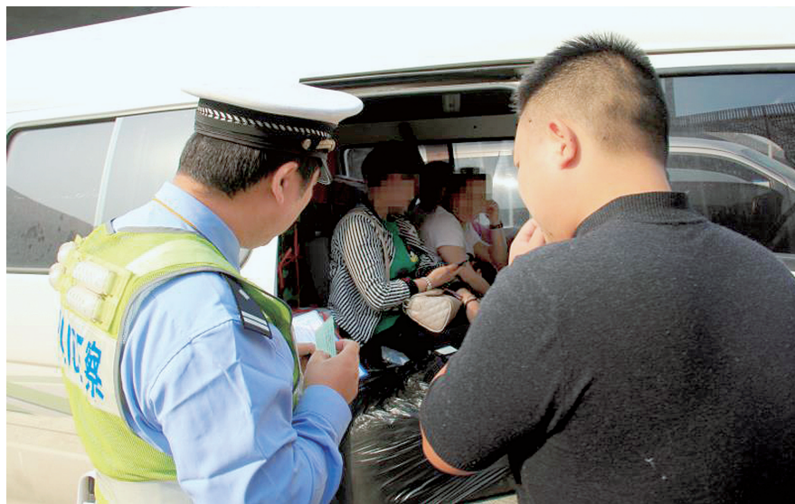
面包车客货混装被查

据了解,此次集中行动共查处各类交通违法行为78起。其中,面包车超过核定人数20%以上1起,未超过核定人数20%以上2起,客货混装15起,并查处闯禁行违法32起,涉牌涉证违法2起,其他违法行为26起。