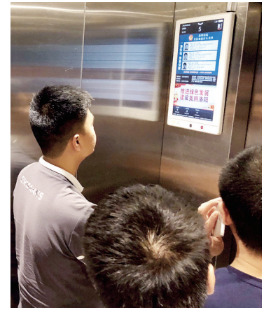
电梯显示屏曝光老赖

本报讯(记者 鲁燕 通讯员 王博文 文/图) 这几天,洛阳市民上下班乘坐小区居民楼电梯,都看到电梯电子屏在循环播放失信被执行人名单。