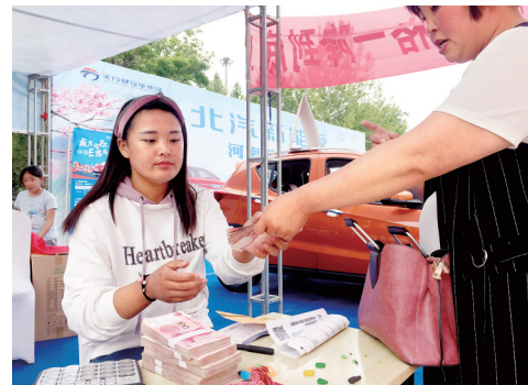
车展现场,中牟市民现金提车