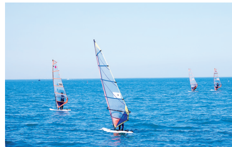
“世界领先”的世帆赛比赛场地