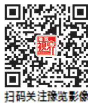
扫码关注豫览影像

日前，首届中国(日照)新闻摄影周暨“东夷小镇”杯“发现日照之美”新闻摄影大赛启动，活动由中国新闻摄影学会、山东省新闻摄影学会、中共日照市委宣传部和日照报业集团等单位联合举办，本报记者应邀和新华社、人民日报等70余家主流媒体的150多名记者一起——探秘阳光海岸，发现日照之美。记者 马健