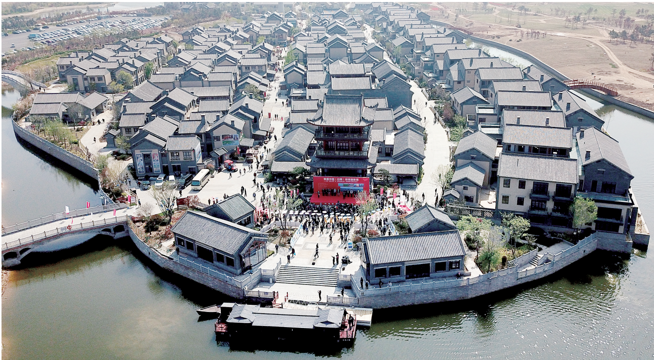
五一节前刚刚投入运营的东夷小镇

日前，首届中国(日照)新闻摄影周暨“东夷小镇”杯“发现日照之美”新闻摄影大赛启动，活动由中国新闻摄影学会、山东省新闻摄影学会、中共日照市委宣传部和日照报业集团等单位联合举办，本报记者应邀和新华社、人民日报等70余家主流媒体的150多名记者一起——探秘阳光海岸，发现日照之美。记者 马健