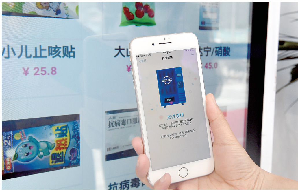
扫码自助买药

不仅如此,支付宝用户还可以通过“国医馆预约挂号”小程序进行名医线上挂号、复诊、健康咨询等服务。如果消费者不愿来药店买药,还能通过该小程序体验在家下单,极速送药上门的O2O购药服务。以张仲景大药房方为例,在郑州三环以内,最快可以实现1小时送达。