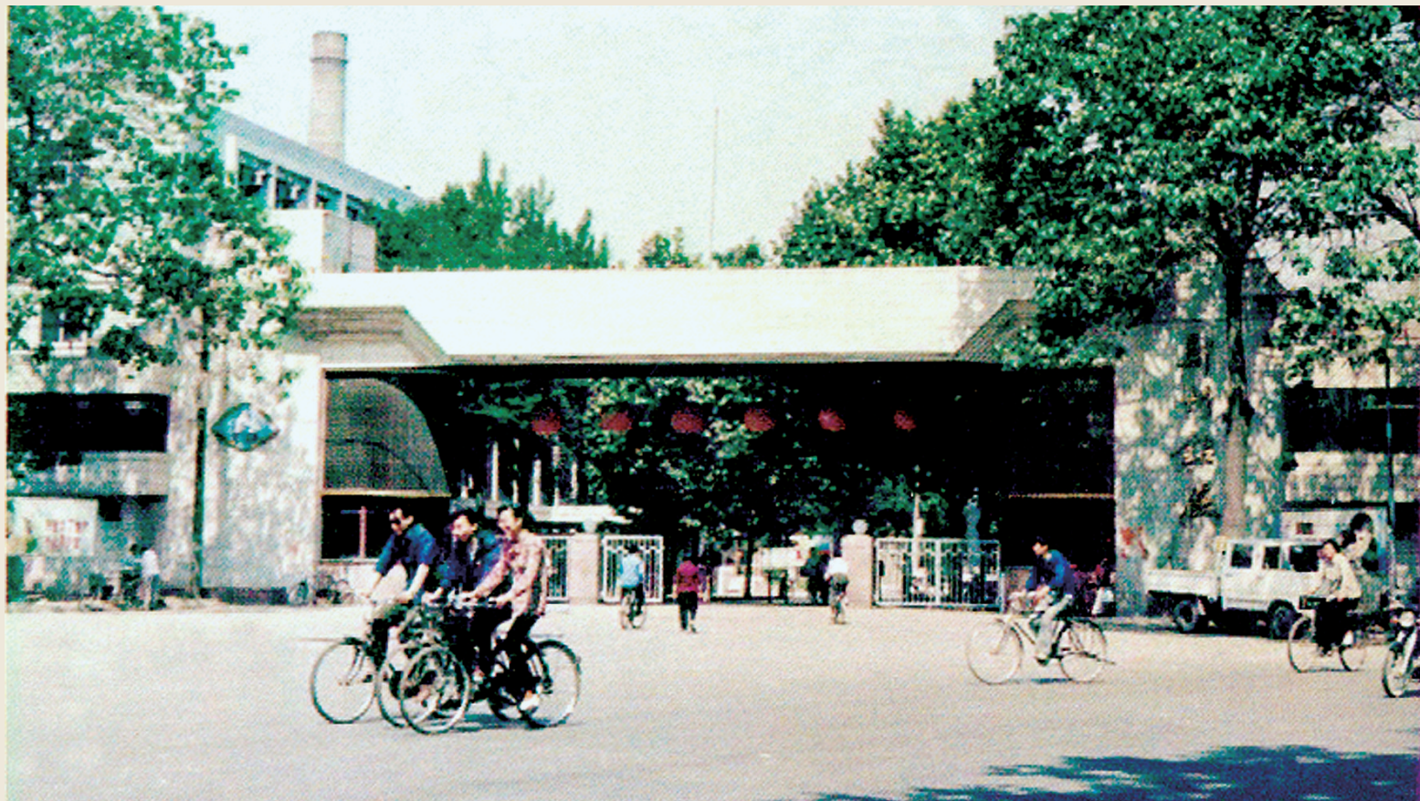
郑州铝厂大门旧址。