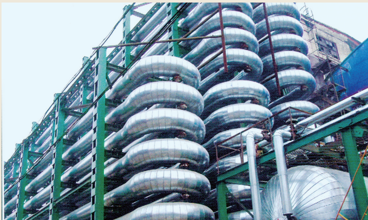
间接加热连续脱硅新工艺(获国家科技进步一等奖)。