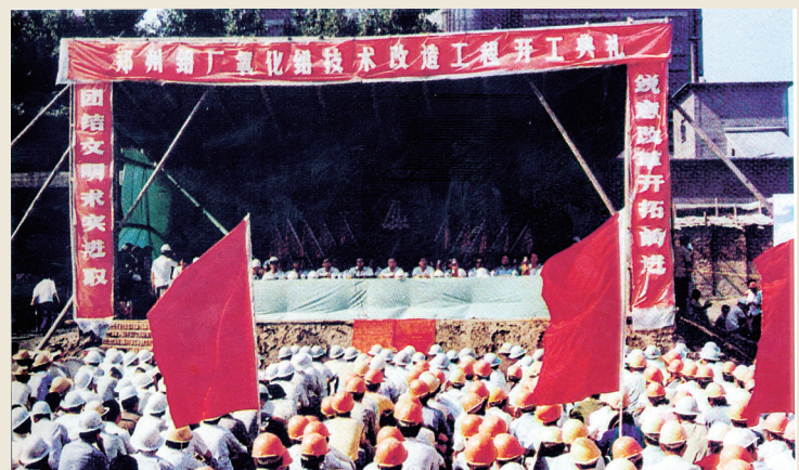
1986年7月,氧化铝技术改造工程开工。