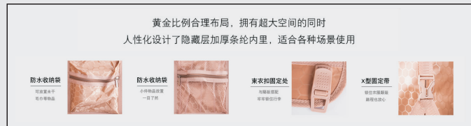
黄金比例合理布局,拥有超大空间的同时 人性化设计了隐藏层加厚软垫内里,适合各种场景使用

静音,美观,360度旋转,顺滑,静音,一体成型的设计和高品质材料,让您的旅程更轻松。