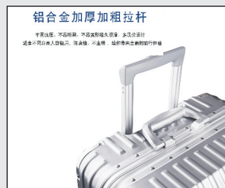
铝合金加厚加粗拉杆

平直拉杆,不弯折,不易变形持久耐用,多次设计,铝合金加厚加粗,强度高,不易变形,耐用持久,使用寿命长。