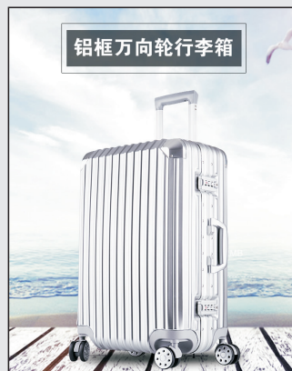
铝框万向轮行李箱