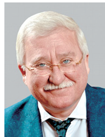
阿斯伽迪亚领导人 伊戈尔·阿舒尔贝利