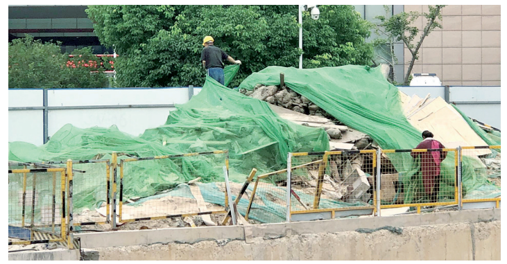
区域内的道路、楼顶、外立面、绿植等进行保洁,切实做好重点区域环境治理。截至目前,累计排查工地5900余次,对辖区内527家餐饮门店反复检查、复查4轮次,排查“小散乱污”企业130余家,下发

针对辖区大气污染防治治理方面存在的问题,结合网格化精准监测平台及城市管控数据,班子成员带头,高位推动,逐条逐项、逐块逐点进行分析研究,深挖污染源,结合污染源实际情况进行精准治理。此外,工作人员在装修、在建的施工工地、汽修等“小散乱污”企业开展24小时不间断巡查,发现问题当场下发整改通知书,督促其限时整改。同时,扩大重点区域保洁范围,增加保洁频次,坚持每天定时对重点