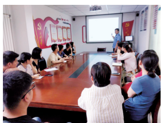
握必要的安全自救知识和逃生技能。此次讲座,共有辖区初高中学生及家长20余人参加。记者 王阳 钱凯悦 通讯员 郑帅 文/图

讲座聘请专业老师,就学生暑期安全防范、紧急救护方法、健康生活方式等相关问题进行讲解。同时,采取互动教学方式,模拟所遇危险,还原事故现场,积极引导青少年朋友通过共同的学习与配合,掌