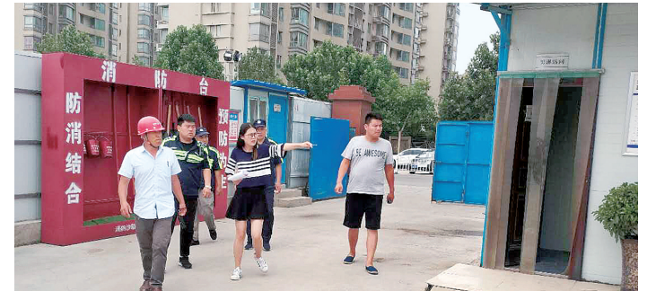
下一步,办事处将对辖区16个样本点工地逐一复查,发现问题及时整改。同时,加大病媒防治宣传力度,广泛发动居民积极参与监督,做好病媒生物预防控制。记者 王阳 钱凯悦 通讯员 赵悟曦 文/图

工作人员针对工地下水道口、通风口防鼠处理措施,工地内洗车槽、排水沟以及洼地积水现象,食堂操作间灶台及其周边卫生状况,工地厕所保洁情况等详细排查。经检查,该工地存在后厨卫生情况较差、有鼠迹但未捕鼠笼等问题,工作人员现场与工地负责人进行沟通,要求其在规定时间内落实整改,并传达爱国卫生杯评比相关工作,希望工地加强重视,积极主动做好病媒防控工作。