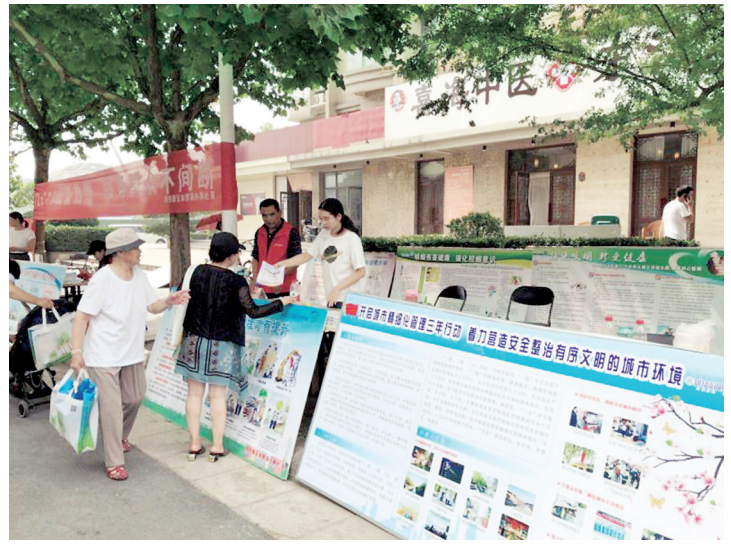
对目前城市精细化管理工作中存在的不足提出宝贵意见。“12319”是郑州市数字化城市管理监督中心的服务热线,是

在精细化宣传展区,工作人员一边向居民分发资料,一边对城市精细化管理工作进行讲解宣传,并解读《郑州市城市精细化管理三年行动实施方案》最新精神,鼓励市民积极参与到城市建设中来。对居民咨询的各种生活中碰到的城市管理方面的问题,工作人员一一耐心回答,并鼓励市民