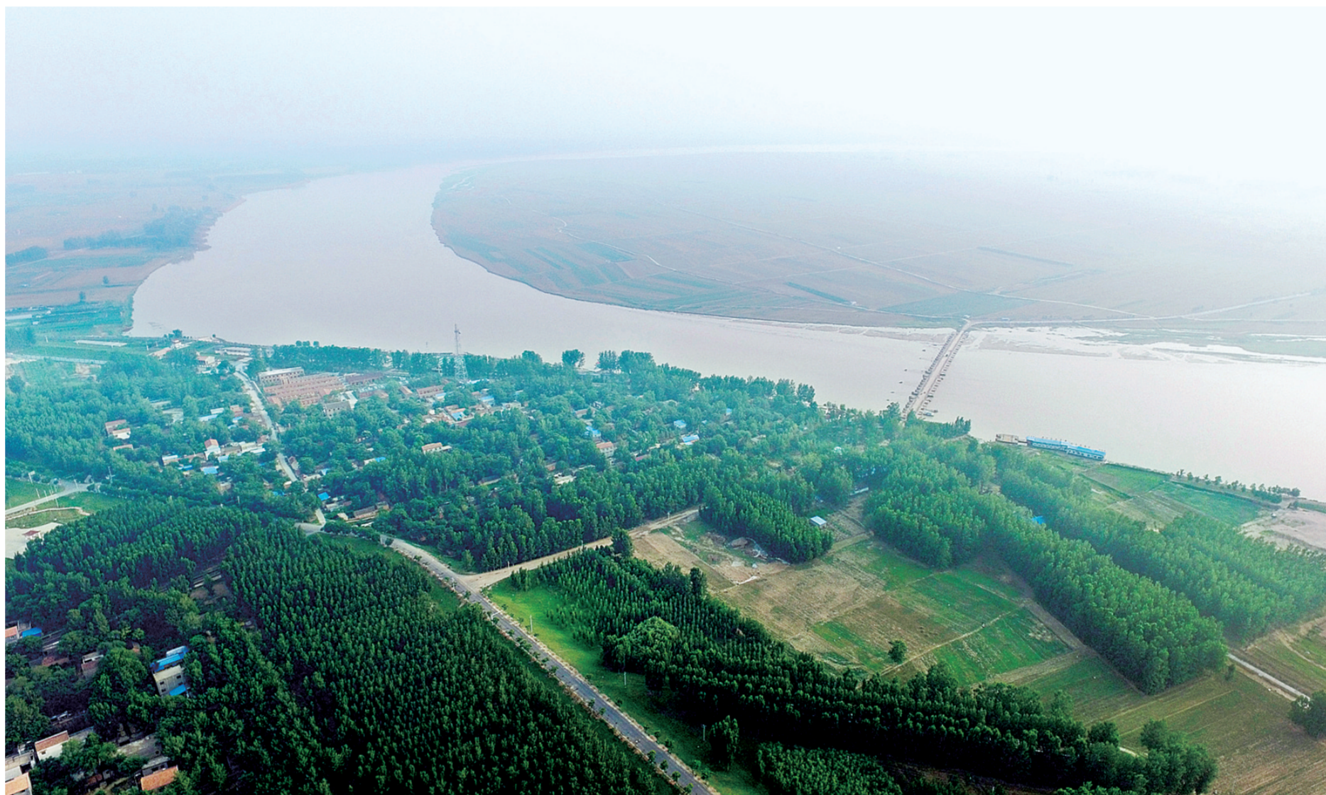
河南兰考张庄村附近蜿蜒的黄河河道