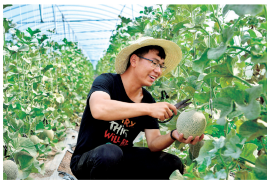
在河南兰考张庄村,一年轻“新农人”在大棚内采摘兰考蜜瓜