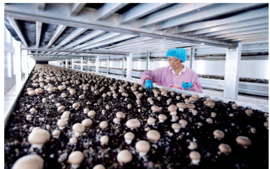
在河南兰考张庄村,村民在当地的食用菌企业车间内采摘褐蘑菇