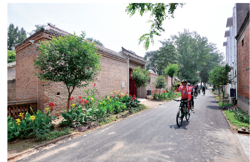
几名自行车爱好者在河南兰考张庄村中骑行