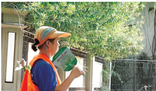
昨日下午4点多,建设路环卫工人摇着扇子工作

本报讯(记者 谷长乐/文 马健/图)根据省气象台最新预报,受强副热带高压控制,昨日起到23日我省将出现持续35℃~37℃、局部39℃~41℃的高温闷热天气,大部地区持续5~7天。