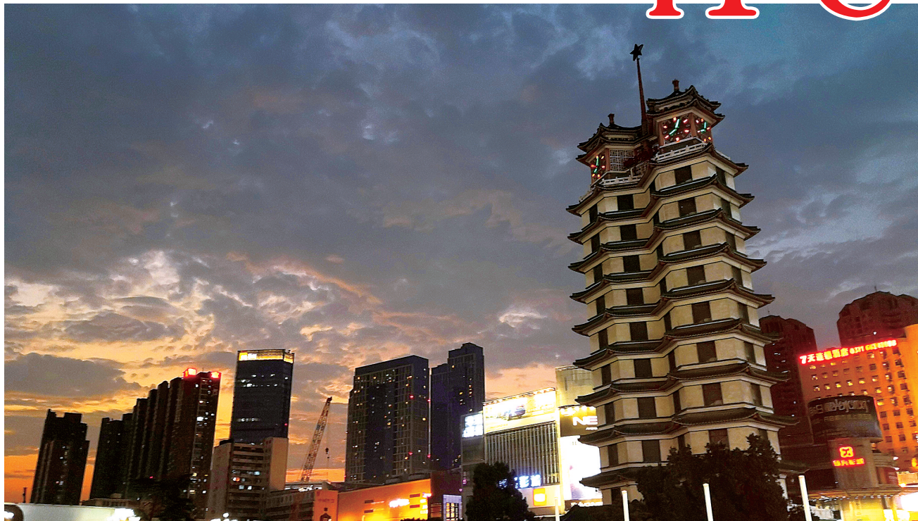
昨日傍晚的二七广场晚霞满天