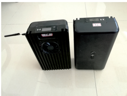
民警在考场附近某茶楼抓获部分犯罪嫌疑人。图为缴获的无线信号发射器

“学费”动辄数万元的职业资格考试“保过班”，竟是靠考场作弊来兑现“保过”承诺。近年来，一些职业资格考试火爆，部分教育咨询机构盯上这一商机，向考生收取3万~6万元不等的“保过费”，试图以组织考生作弊来牟取暴利。今年7月，湖南省常德市公安局侦破了一起二级建造师考试作弊案，由此揭开了一条以考试“保过”为噱头的黑色产业链。