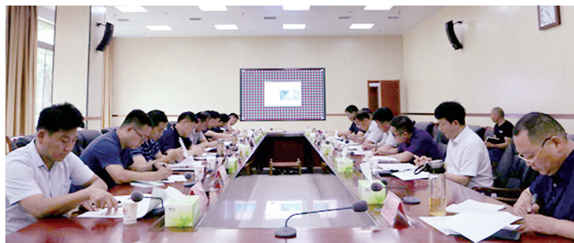
经开区预拌混凝土生产企业整治工作推进会

覆盖是否完全、是否湿法作业、围挡是否规范完整等问题。排查中发现锦龙二期、龙渠二期、九龙大道北侧部分绿网覆盖不完善、无湿法作业,现场要求负责人立即停工整改,要求严格落实“八个百分之百”标准,切实做好大气污染防治工作。