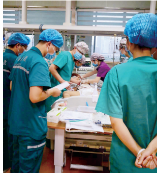
孩子在医院抢救中

8月29日下午,经过抢救,孩子暂时生命体征稳定,但是还没有脱离生命危险。孩子家长透露,预计两天后检查结果会出来。医院已经请来了权威的专家,准备帮孩子会诊。