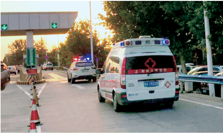
急救车在警车护送下过收费站